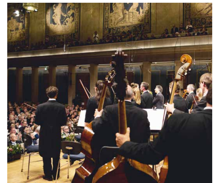
ARD-Musikwettbewerb: Frauenquote, mal anders