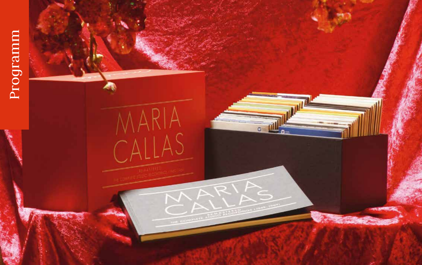
Weihnachtsgeschenke: Schöne Bescherung für Freunde der Oper