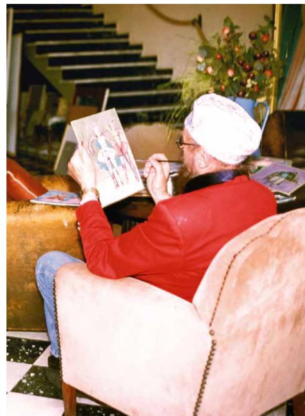
Ernst Fuchs: Der »Malerfürst« über perfekte Bühnenbilder