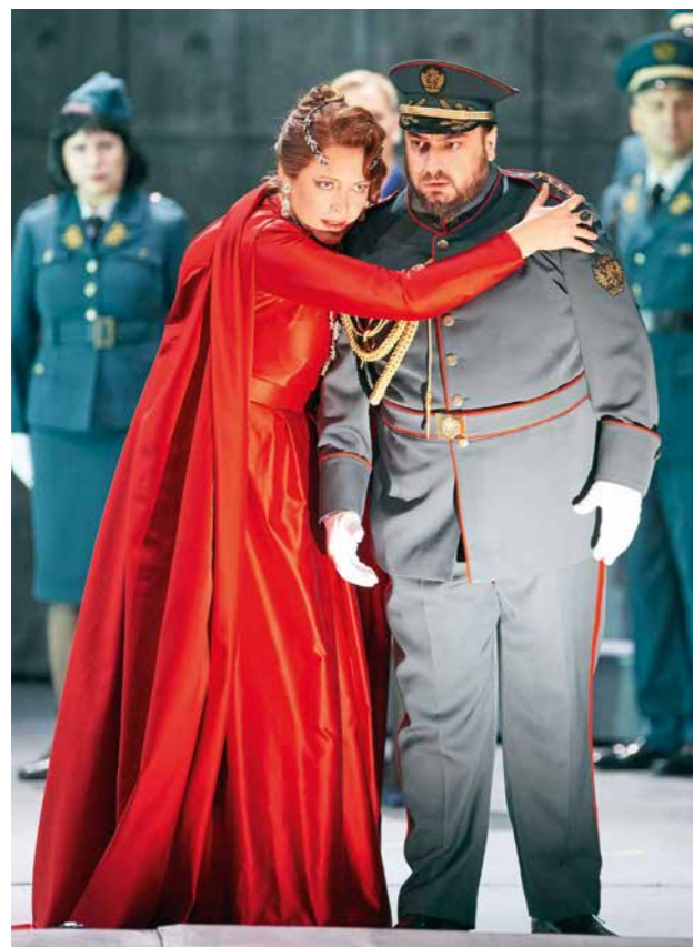
Für Sie gesehen: Opern-Nachlese der ORPHEUS-Mitarbeiter