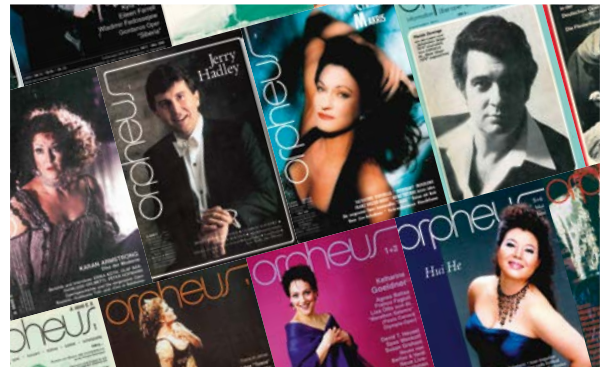
Vor 45 Jahren wurde ein leidenschaftliches Opernmagazin gegründet Seite 76