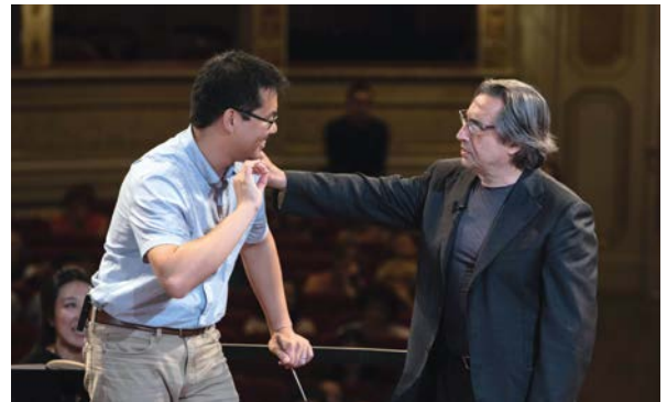
In Ravenna gibt Riccardo Muti sein Wissen an junge Talente weiter Seite 81