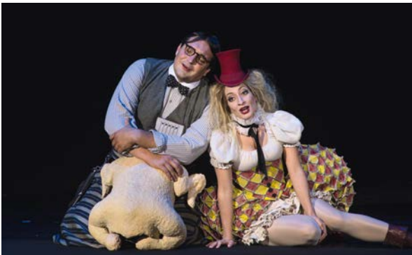
Ambitioniert, vielleicht überambitioniert: Mozarts »Zauberflöte« in Salzburg Seite 71