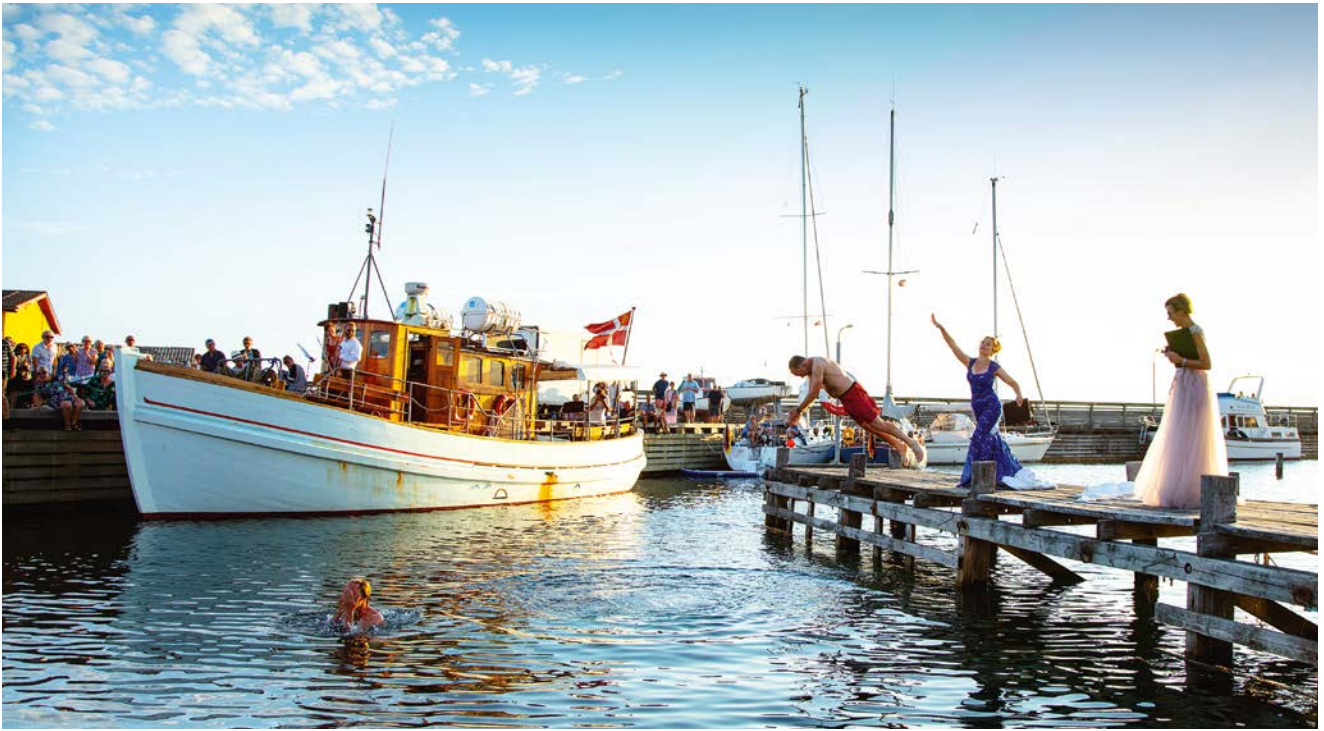
Wenn Sänger nach erfolgreicher Arbeit baden gehen: Die dänische Insel Samsø ist der Schauplatz eines erfrischenden Opernfestivals